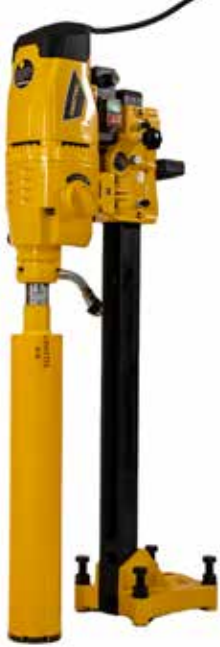
SIVI YAĞLI ŞANZIMAN