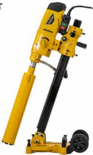
SIVI YAĞLI ŞANZIMAN